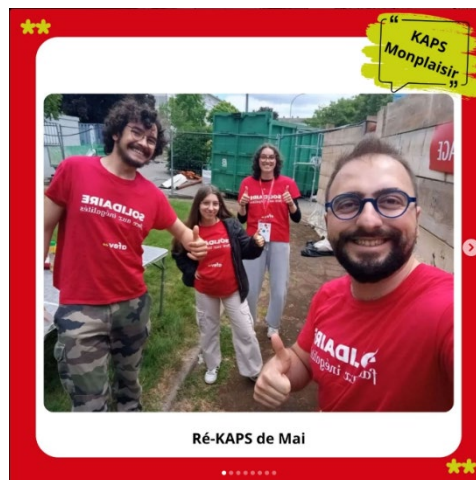
Figure 7 Ré-Kaps de Mai 2025

Je participe également à des actions ponctuelles telles que des cinémas en plein air ou d'autres événements festifs. Ces projets contribuent à animer la vie locale et à favoriser la mixité sociale, en réunissant des personnes de tous âges et horizons autour d'une expérience commune. Ce sont des moments où la culture, le partage et la citoyenneté se rencontrent concrètement.