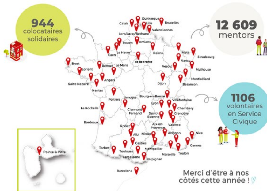
Figure 2 Carte de France des villes où l'AFEV est présente pour l'année 2025-2026 / Source : Mail personnel

L'AFEV a un maillage territorial et un ancrage territorial très large sur tout le territoire national. Elle agit dans plus de 40 villes en France et une ville à Barcelone et 300 quartiers populaires.