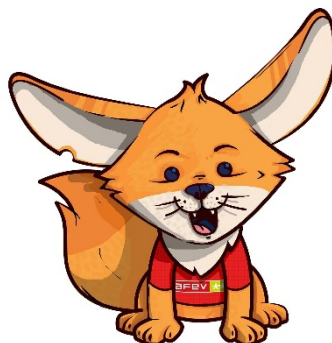
Figure 5 Chatbot Aiko

Son objectif est de favoriser l'autonomie et le développement de la personne accompagnée en établissant des objectifs qui évoluent et s'adaptent en fonction des besoins spécifiques. Chaque mois, on est contactée par notre référent AFEV pour faire le point sur les dernières séances. Ce suivi est complété par un outil numérique dédiée au mentor : Aiko. C'est un chatbot, un programme conversationnel qui permet, en 2 min, de partager ce qu'il s'est passé lors de notre dernière séance ou d'informer que notre séance a été annulée.