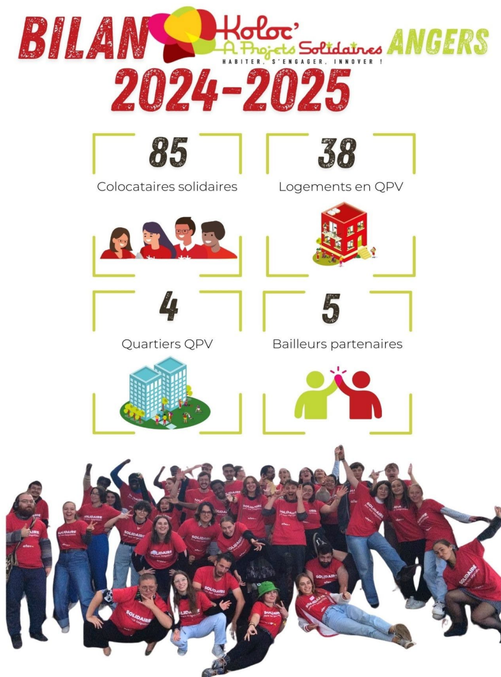
Figure 4 Le Bilan des Kolocs à Angers

En 2025, l'Afev Angers possède deux bureaux, l'un à Belle Beille afin d'être proche du campus étudiant de l'Université d'Angers, l'un à Monplaisir, afin d'être proche de trois quartiers sur lesquels l'Afev agit (Belle Beille, Monplaisir, Savary Giran et Grand Pigeon). Elle compte 9 salariées, une équipe entièrement féminine, ainsi qu'une équipe de 32 volontaires en service civique répartis selon les différents dispositifs de l'antenne.